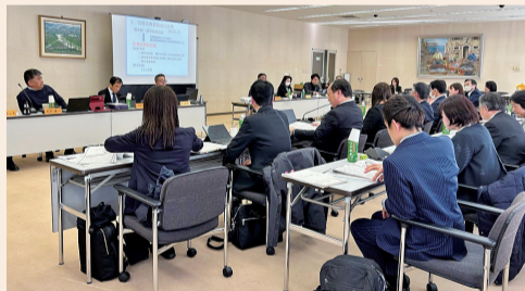
議員研修会の様子

今回の研修を踏まえ、市民の皆さんにとって開かれた市議会となるよう、様々な改革への取組を進めていきます。