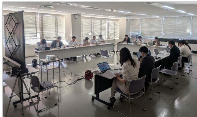
<ワーキングの様子>