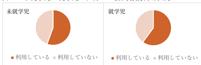
表4 未就学児・就学児に区分した訪問看護利用状況