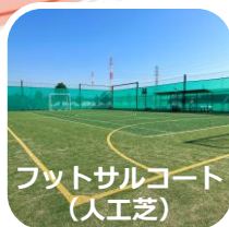
フットサルコート (人工芝)