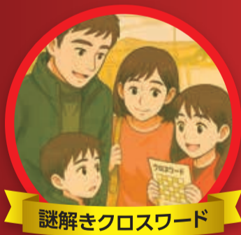
謎解きクロスワード