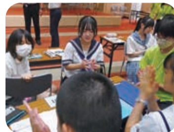
さまざまな意見に触れられたグループディスカッション

グループ討議では、全国から集まった参加者が、それぞれの地域で第二次世界大戦中にどのような被害があったか、平和でない状態とは何か、それをどうすれば解決できるのかといった課題について意見を交わしました。生徒たちは、異なる背景を持つ同世代の考えに触れながら、自分自身の視点を見つめ直し、平和についての理解を深めていました。