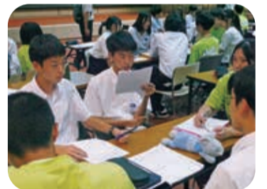
全国から828人が参加した平和学習の集い