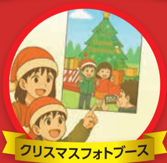
クリスマスフォトブース