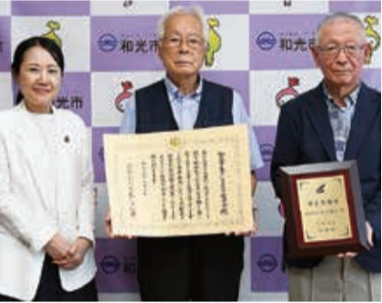
市長表敬訪問の様子

社会参加章は、高齢者の社会参加を促進する優れた取り組みに贈られる表彰です。連合会は毎週のグラウンド・ゴルフ練習会を20年以上継続し、運営の担い手育成にも努めました。地域の高齢者がいきいきと活動できる環境づくりが高く評価され、全国の模範となる団体として選ばれました。