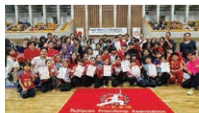
全国大会の予選「南関東大会」で優勝者続出!

ただ武術太極拳を学ぶだけでなく、 アスリートとしてのあり方を学び、 多様性あるメンバーと交流し、社 会に貢献できる人材になることを モットーとして、単なる習い事の域 を超えて、一緒に楽しんで練習しま せんか?