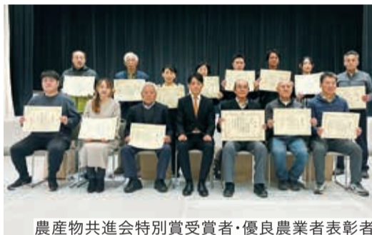
農産物共進会特別賞受賞者・優良農業者表彰者