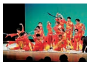
2023年にサンアゼリアにて 行われたチーム公演

地域のお祭りや福祉施設でのイベントなどにも積極的に出演しており、地域に根ざした活動をととして健康増進と青少年育成に力を入れています。また、2023年には樹林公園にて「市民健康まつり」、サンアゼリア大ホールにて「カンフースーパーアクション」という自主舞台を行い、1,000人以上の皆さんにお越しいただきました。今年も12月7日(日)にサンアゼリア大ホールでイベントを行いますので、ぜひお越しください。