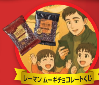
レーマンムーギチョコレートくじ