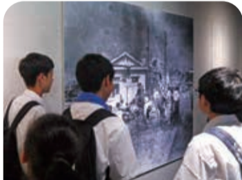
資料館の展示に無言の悲しみを感じました

8月6日(水)には平和記念式典に参列し、全国から集まった方々とともに、静かに祈りを捧げる時間を共有しました。平和記念資料館では、被爆の実態や当時の暮らしに触れ、命の尊さをあらためて心に刻みました。