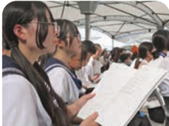
平和への思いが一体となった記念式典