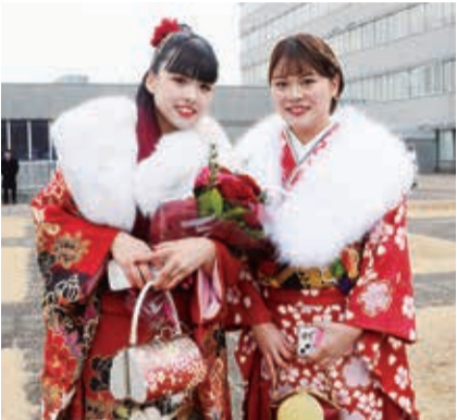
図 令和8年1月11日(日)13:30～15:00 場 サンアゼリア 大ホール 図 平成17年4月2日～平成18年4月1日 生まれの人 持 案内ハガキ(12月上旬に発送予定) ●市外の人でも当日受け付けで参加できます。 ●詳細は市HPで▶