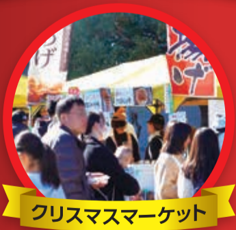
クリスマスマーケット