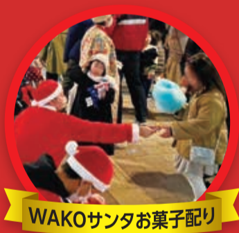
WAKOサンタお菓子配り