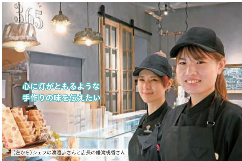
図 秘書広報課 シティプロモーション担当 ☎424-9091