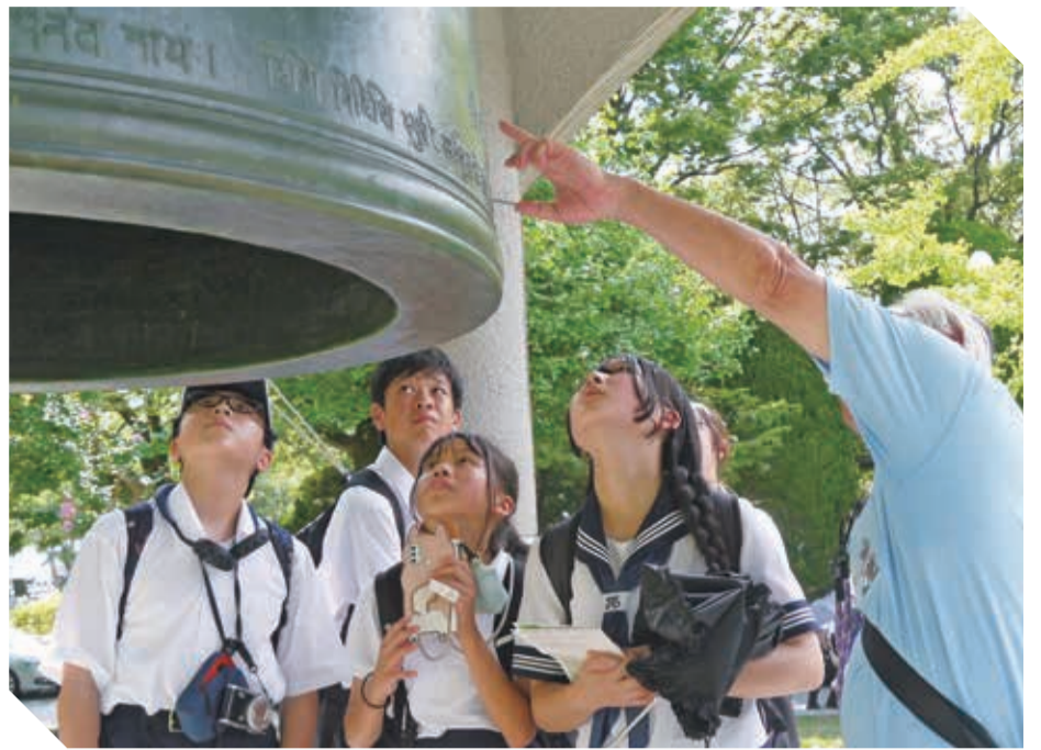
平和の鐘に刻まれたメッセージを読む