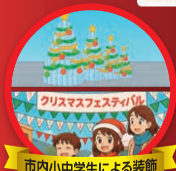
市内小中学生による装飾