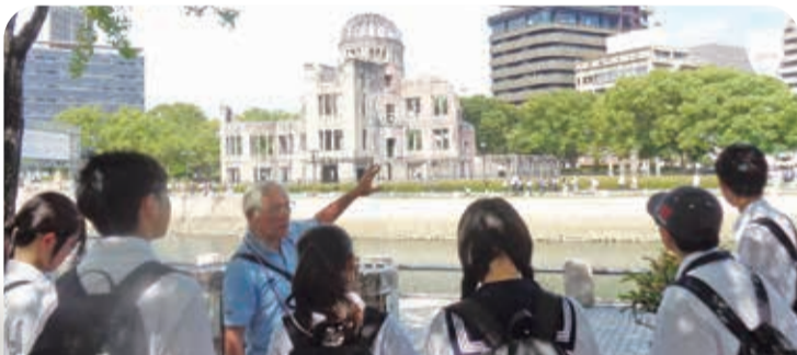
原爆ドームを望みながら平和記念公園の成り立ちを学ぶ