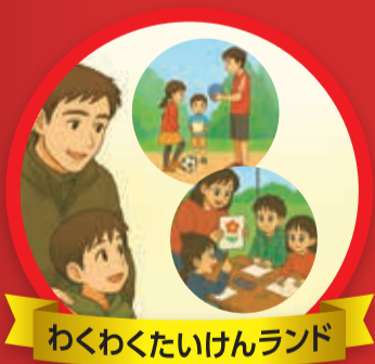
わくわくたいけんランド