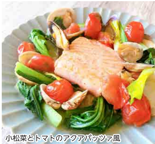
小松菜とトマトのアクアパッツァ風