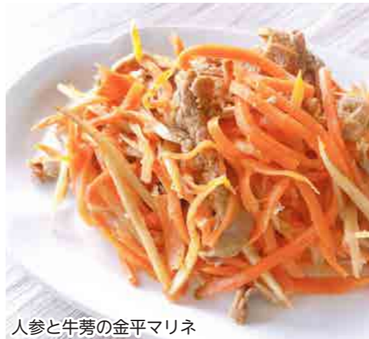
人参と牛蒡の金平マリネ