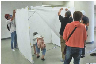
▲避難所機材の組み立て