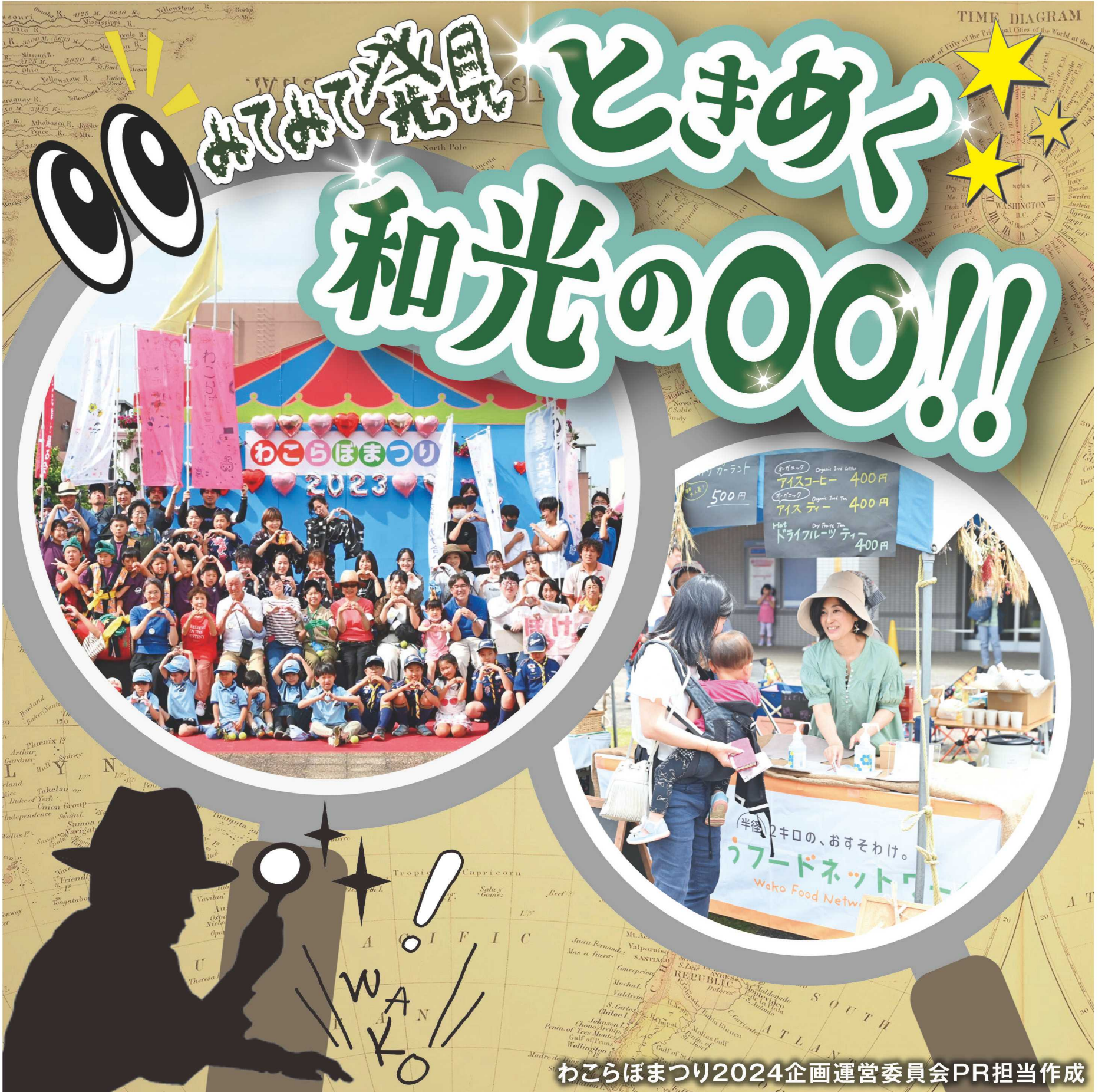
わくらぼまつり2024企画運営委員会PR担当作成