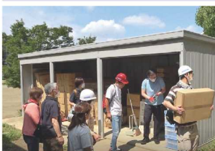
▲防災倉庫から必要物資の運び出し