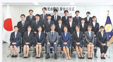
令和6年度新規職員