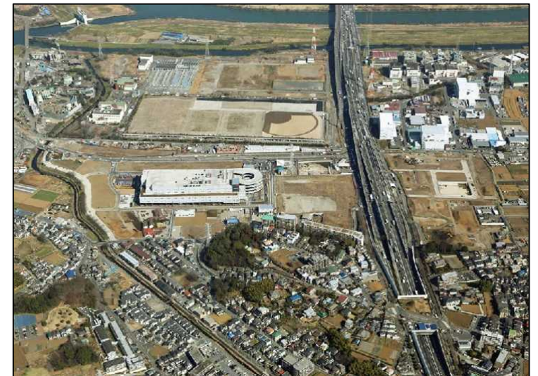
航空写真