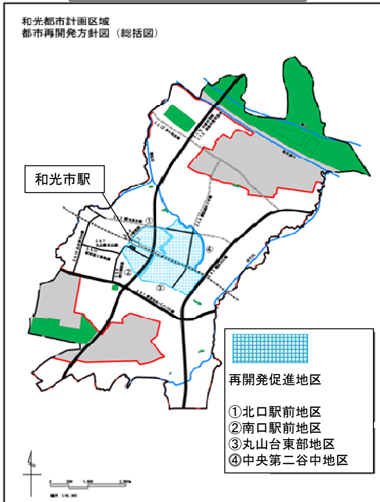
都市再開発方針図（総括図）