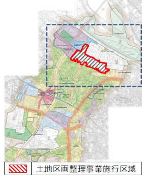
和光北インター東部地区土地 区画整理事業施行区域

以上の背景を踏まえ、新たな産業基盤の整備と既存の住環境の保護を目的として、土地区画整理事業の検討をはじめ、この度、都市計画変更手続きを行うものです。