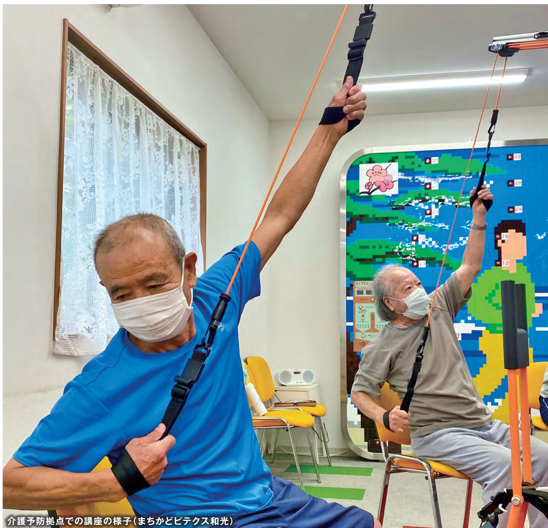
介護予防拠点での講座の様子(まちかどピテクス和光)

〔編集・発行〕和光市企画部秘書広報課 http://www.city.wako.lg.jp 〒351-0192 埼玉県和光市広沢1-5 ☎048-464-1111(代表)