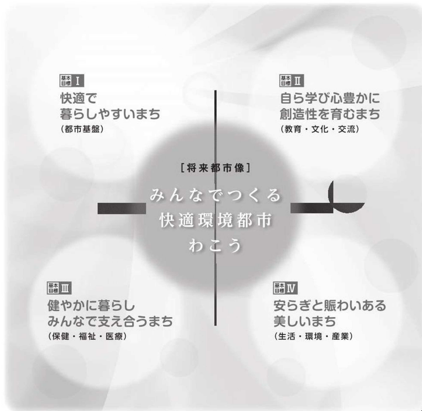
図表3 公共施設マネジメントによる「快適環境都市」の拠点づくり