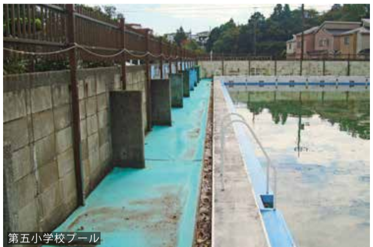
第五小学校プール