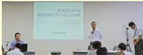
福祉や公会計で注目されています。

■平成30年7月豪雨において、お亡くなりになられた方々のご冥福をお祈り申し上げますとともに、被災された方々に謹んでお見舞い申し上げます。和光市議会では、総務環境常任委員会の行政視察を予定していた呉市と倉敷市に、今後の復旧・復興にお役立ていただくため、それぞれ10万円の義援金をお送りしました。今後も義援活動に取り組んでまいります。