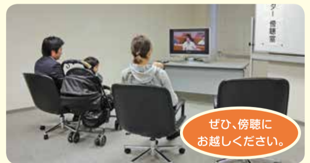
小さなお子さんと一緒に傍聴できるモニター傍聴室もあります