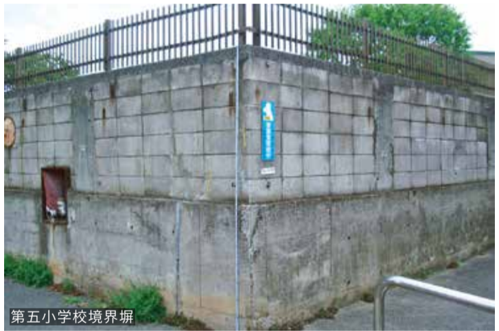
第五小学校境界塀