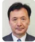
金井伸夫 (日本維新の会)