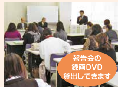
報告会の録画DVD貸出できます

皆様からいただきましたご意見に関しては、議会活動を通して市政へ反映させるとともに、今後につきましても試行錯誤しながら議会報告会を開催し、より開かれた議会を目指して取り組んでまいります。