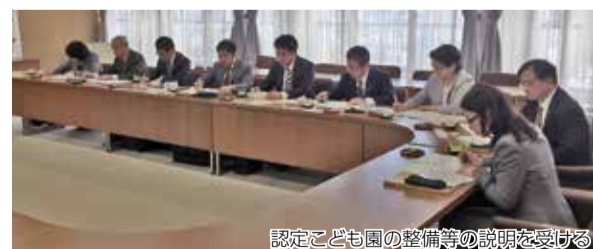
認定子ども園の整備等の説明を受ける

【豊橋市】 平成25年度に実施したニーズ調査から、教育・保育の量を見込み、対応する量の確保のため定員を増やし、「子ども・子育て応援プラン」に基づいて、認定子ども園の整備や保育園からの移行を行っている。これまで国基準での待機児童は発生したことがない。