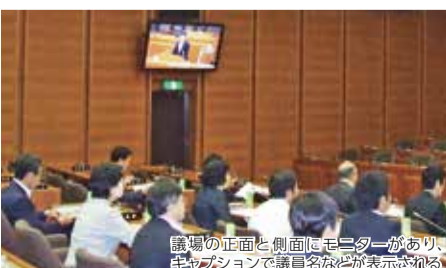
議場の正面と側面はモニターがあり、キャプションで議員名などが表示される

平成28年7月21日(木)議員間討議、執行部への反問権の付与など様々な議会運営・議会改革に取り組んでいる千葉県柏市議会を行政視察しました。現状では、市長提出議案に対する議員間討議の具体的な事例が少ないことから、今後とも調査研究を継続し、政策立案及び政策提言のできる議会を目指し議会改革に取り組んでまいります。