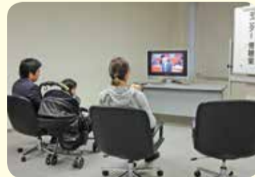
小さなお子さんと一緒に傍聴できるモニター傍聴室もあります