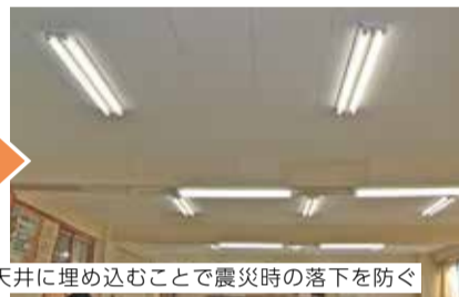
耐震化の工事例として、吊り下げ式の照明を天井に埋め込むことで震災時の落下を防ぐ