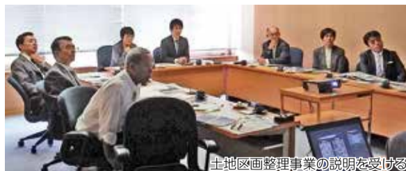
土地地区画整理事業の説明を受ける

【白山市】 北陸新幹線整備に伴い、松任駅を中心に市施行の松任駅南土地地区画整理事業と、組合施行の松任駅北相木地区土地地区画整理事業に同時期に取り組む。南側は公共施設が集積し、商業・文化の拠点であり、北側は住宅と田園地帯が広がる。新幹線整備時の松任駅の建てかえの際には構内に南北間をつなぐ自由通路と、駅の南北を結ぶ幹線道路を整備した。