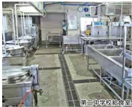
第二中学校給食室

昭和45年に建築された第二中学校給食室の老朽化が進み、衛生面に懸念があることから、ドライシステム化された給食室に改築するための工事の請負契約を、ダイレクト型一般競争入札により株式会社佐伯工務店と契約金額2億8,274万4千円で締結することについて原案のとおり可決しました。