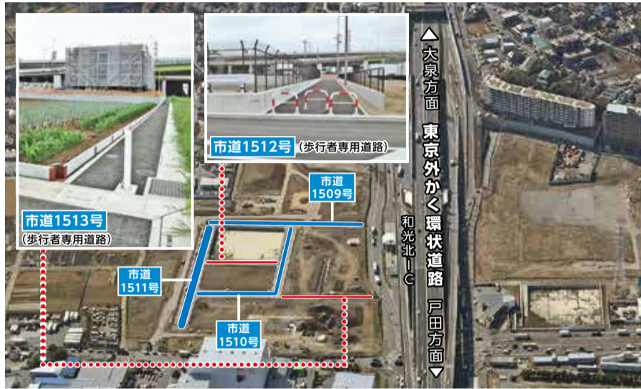
△大泉方面 東京外かく環状道路 戸田方面 和光北インター

また、開発行為により帰属された、下新倉五丁目367番3地先から8地先までの路線を市道641号線として認定しました。