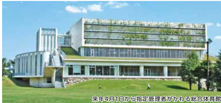
来年4月1日から指定管理者がかわる総合体育館

平成29年4月1日から平成34年3月31日までの期間、セイカスポーツセンター・クリーン工房共同事業体を公募により指定管理者として指定しました。