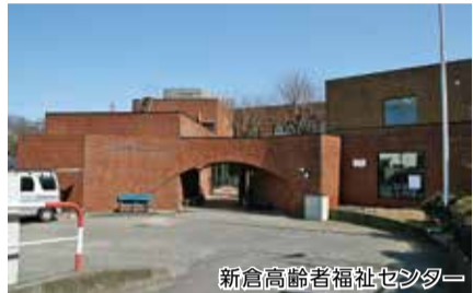
新倉高齢者福祉センター

平成29年4月1日から平成34年3月31日までの期間、株式会社日本生科学研究所を公募により指定管理者として指定しました。