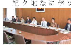
明石市で教育プラン策定前後の取り組みを伺う

加古川市▼平成20年に「スポーツ振興基本計画」を策定。現在、31のスポーツクラブが小学校区を基盤に活動するなど、総合型地域スポーツクラブの取り組みを推進。