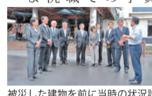
被災した建物を前に当時の状況説明を受ける

宮古市・大船渡市▼復興まちづくり計画に対する意見聴取等を実施。なお、大船渡市に対する支援として和光市は、平成23年度から市職員を派遣し、学校事務などの支援を行っており、派遣職員からも状況説明を受けました。