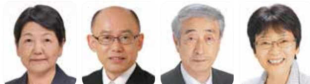
村田富士子 (公明党) 齊藤克己 (公明党) 熊谷二郎 (日本共産党) 吉田けさみ (日本共産党)