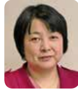
待鳥美光 (新しい風)