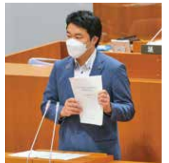
6月定例会開会日 で特別委員会の報告 を行う安保委員長

最終報告書は、市議会ホームページ、市議会図書室、市役所3階行政資料コーナー、和光市図書館(本館・分館)、公民館等でご覧いただけます。