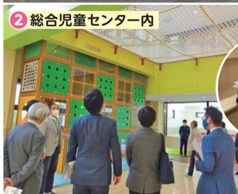
2 総合児童センター内