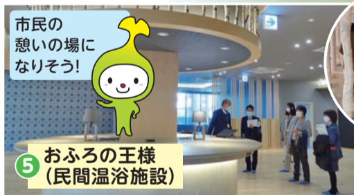
5 おふろの王様 (民間温浴施設)