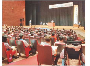
埼玉県市議会第5区議長会研修会

講義の中で、首長は自分の意見に反対することができないが、議員は議会で話し合うことができるという話を聞き、議員間議論に取り組む重要性を改めて考える機会となりました。