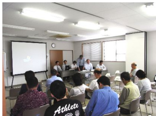
写真：説明会の様子（6月5日）