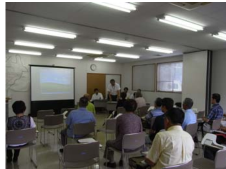
意向調査説明会の様子