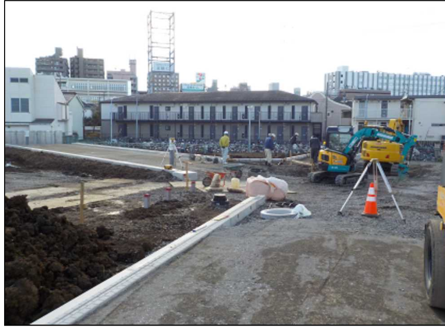
区12-1号線と区6-8号線の整備状況