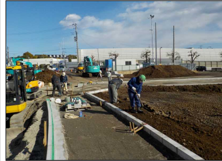
施工中の区12-1号線歩道部