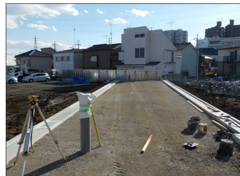
区6-8号線(路盤まで完了)