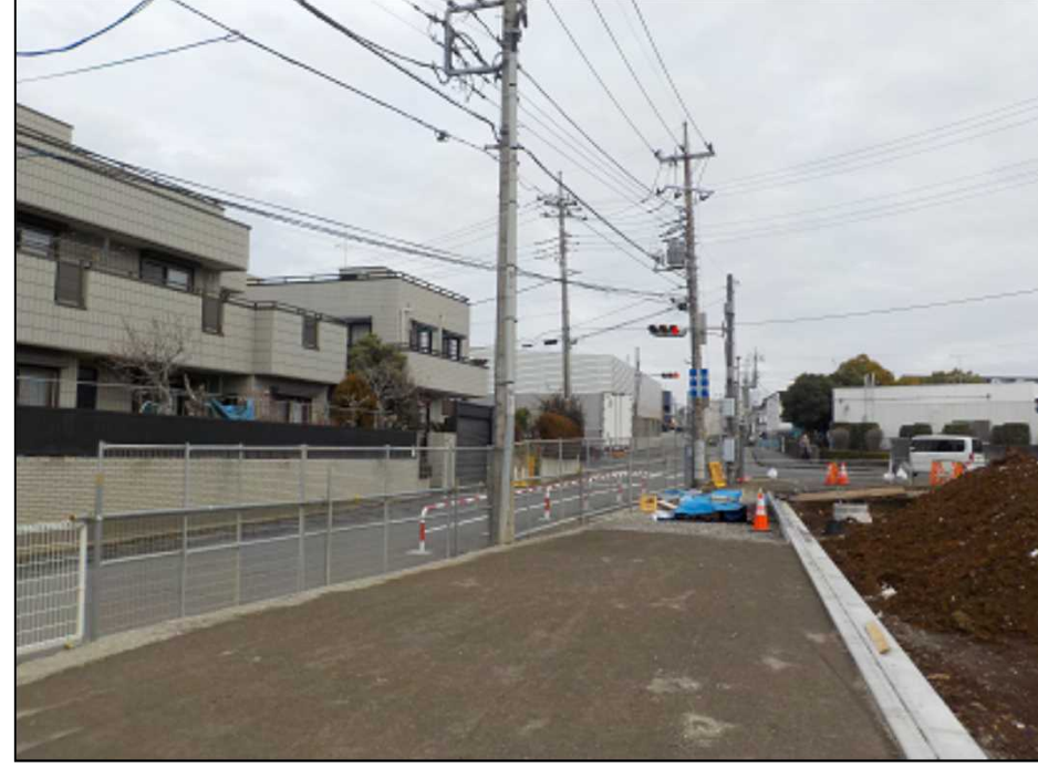
区12-1号線(車道路盤まで完了)