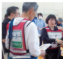
女性のリーダーと男女2人のサブリーダーが活躍していました

これまでは、「男性は避難所運営リーダー」「女性は炊き出し担当」など性別により役割分担が決まる傾向がありましたが、性別で特定の役割が偏らないように分担し、避難者みんなで避難所を運営していくことが重要です。