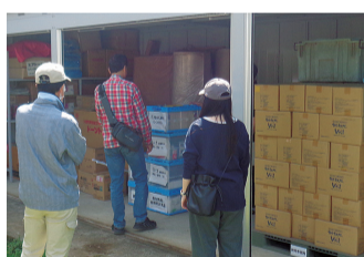
防災倉庫内備蓄品

災害時の備蓄は誰にとっても必要ですが、とりわけ女性や育児中、介護中の家庭など特有のニーズに合わせる必要があります。例えば女性に対しては用途に応じた生理用品、子育て世帯にはおむつや授乳用品など、備蓄品は十分な量を確保する必要があります。