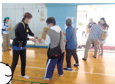
地域防災訓練でのバケツリレー