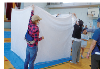
地域防災訓練でのパーテーション組み立て

北原小学校での訓練では簡易パーテーションを組み立てて設置するなど、プライバシーを守るためのスペースを確保していました。