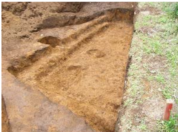
平安時代住居跡完掘状況