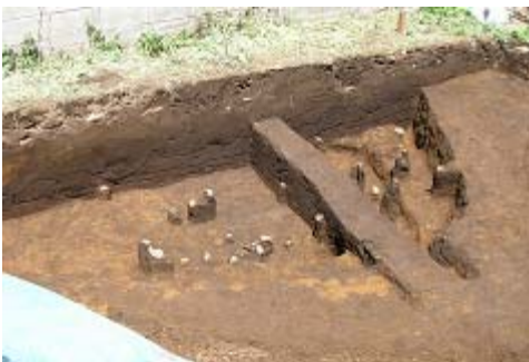
平安時代住居跡遺物出土状況