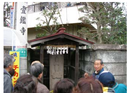
◇フィールドワークの様子