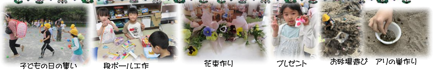
子どもの日の集い 段ボール工作 花束作り プレゼント お砂場遊び アリの巣作り