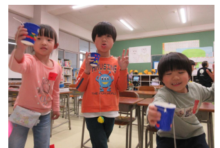
わこうっこに1年生がやってきた！好きな遊びはなに？