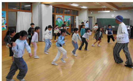
11/18 ヒップホップダンス