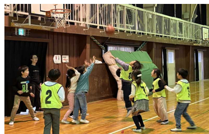
12/2 バスケットボール