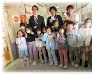
勤労感謝の日プレゼント