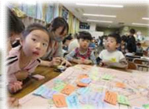
学童共催:防犯マップ