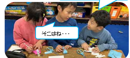
ここどうすればいいの?