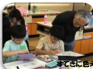
すてきに色えんぴつ画