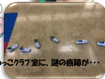
わこうっこクラブ室に、謎の痕跡が…