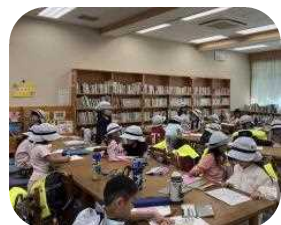
【4月のわこうっこクラブ】

※記録用の写真をHPやおたより等に掲載することがあります。掲載を同意されない方は事前にご連絡ください。