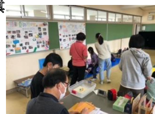
卒業した6年生も春休み中 遊びに来てくれました