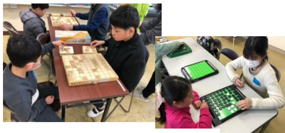
わしゃ王決定戦 オセロの部