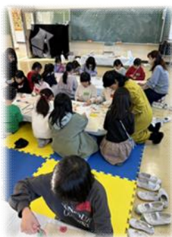
学童クラブ交流/わしゃ王決定戦 将棋