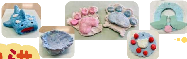
紙ねんどで 自由工作