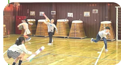
厚紙の位置を変えると飛距離が のびることを発見したよ