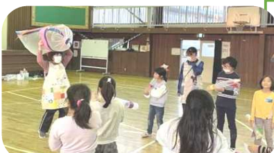
ゴミ袋の大ロケットは飛ばなかったね