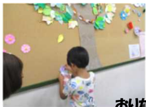
お礼がみウィーク