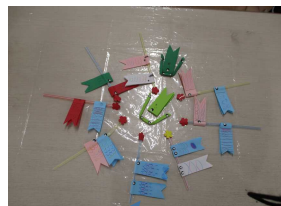
学童クラブと合同避難訓練