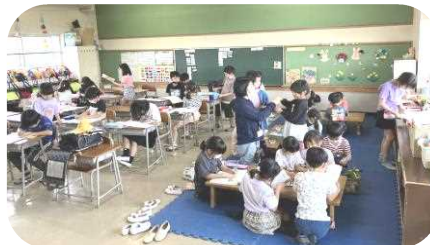
宿題や遊び・工作など何をやるか時間の使い方は子ども達の自主管理

定員: 20名 参加費: 無料 持ち物他: 水筒、汗ふきタオル 動きやすい服装で 申込締切: 7月3日(月)