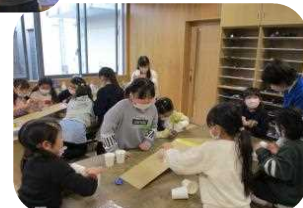
【昨年度の子ども教室の様子】

*記録用の写真をHPやおたより等に掲載することがあります。掲載を同意されない方は事前にご連絡ください。