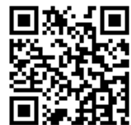
【登録 QR コード】

※2年生以上で昨年度登録を済ませている方は、 学年・組等の情報更新をしてください。