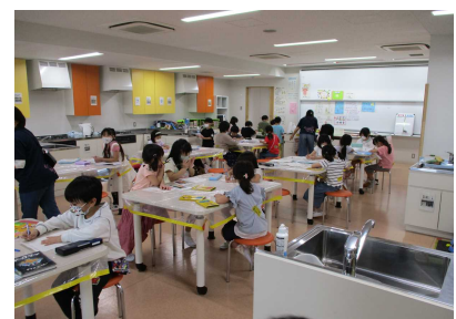
【わこうっこクラブの様子】

※記録用の写真をHPやおたより等に掲載することがあります。掲載を同意されない方は事前にご連絡ください。