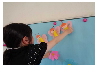
【わこうっこクラブの様子】

※記録用の写真をHPやおたより等に掲載することがあります。掲載を同意されない方は事前にご連絡ください。