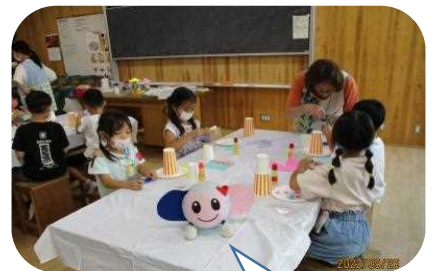
下新倉児童館工作