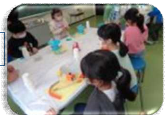
下新倉児童館共催 ビー玉de科学工作