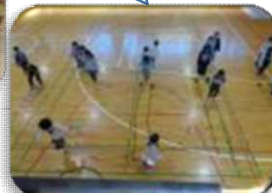
脳トレ体動かしゲーム