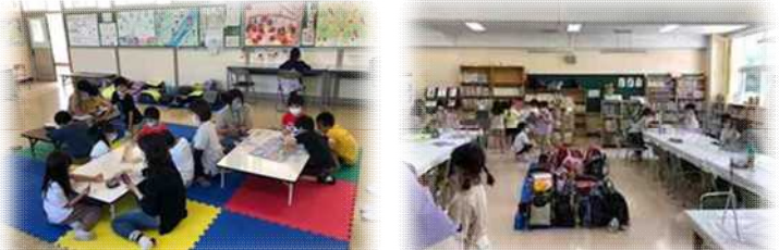
わこうっこクラブで、子ども達は楽しく過ごしています。