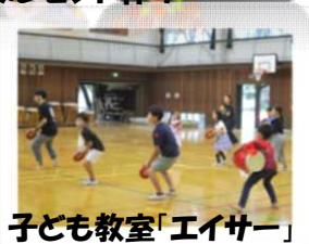
子ども教室「エイサー」