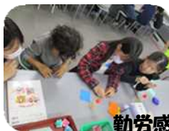
勤労感謝の日プレゼント作り