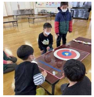
児童館のおもしろ記録会

利用時間: 9時~17時 利用方法などは夏休みと同じです。ご不明な点は、わこうっこクラブへお問い合わせください。