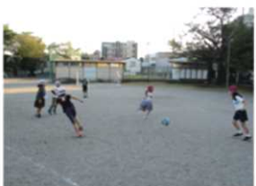
ドッジボールウィーク