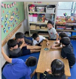
←いっしょにいただけ 笑いがとまらないよ!