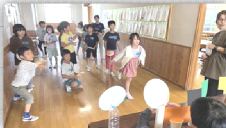
わくわく English (10/6)